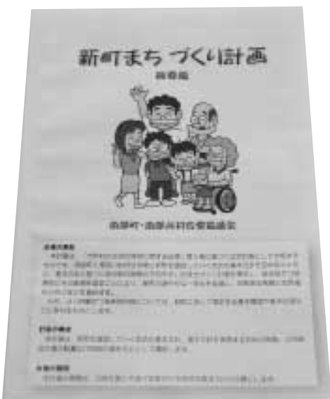
新町まちづくり計画(概要版)

新町まちづくり計画につきましては、昨年12月に配布しました「新町まちづくり計画(概要版)」で、ご確認ください。