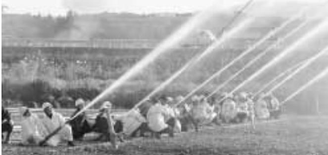
南部川村消防団 出初式（鈴割り競技）