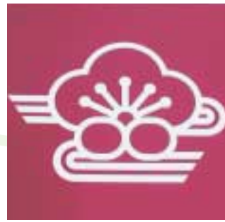
現在の南部川村章 恵まれた自然環境のなかで村の象徴である梅と炭の王様と言われる備長炭を特産物に、豊かな住みよい農業の村として発展していく姿を表しています。