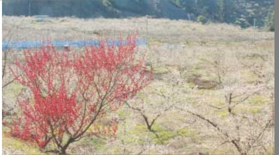
写真は昨年撮影したものです

早春の南部梅林には、日本一の梅の里にふさわしい華麗な風景が広がります。凛と咲く白い花々、はるか彼方の山々まで梅の花がおい、あたり一面を甘酸っぱい香りで包んでくれます。