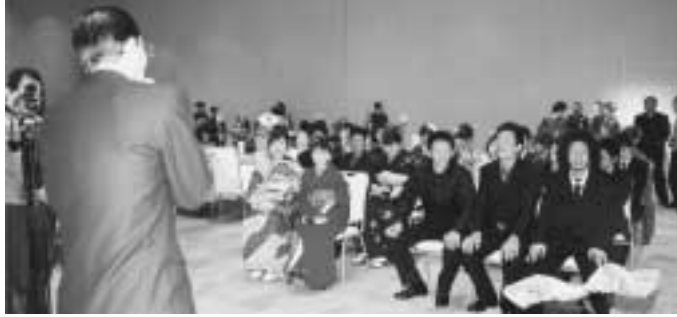
南部町新成人の集い (中学時代の恩師を迎えてホームルーム)

婦人団体については、合併後新町において連合組織の結成に向けて関係婦人団体を調整する。 公民館については、現在