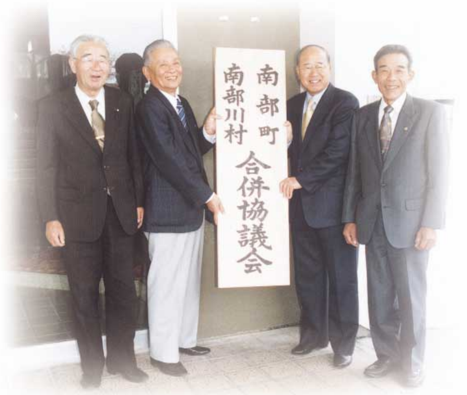
左から玉井南部町議会議長、山崎南部町長、山田南部川村長、小山南部川村議会議長